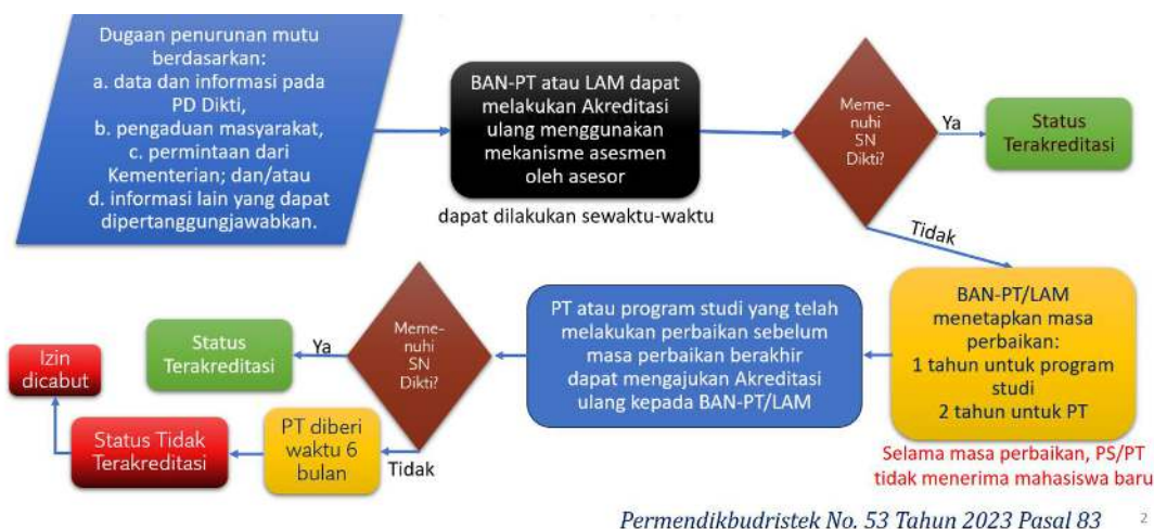
Gambar 2. Akreditasi ulang dalam hal terdapat dugaan penurunan mutu (Kebijakan Akreditasi, MA BAN-PT, 2025)

Sesuai Pasal 83 Peraturan Mendikbudristek Nomor 53 Tahun 2023, akreditasi ulang dapat dilakukan apabila diduga terdapat penurunan mutu program studi, yang informasinya antara lain dapat diperoleh dari PD Dikti (lihat Gambar 2), yaitu melalui mekanisme automasi. Dalam hal mekanisme automasi menunjukkan indikasi bahwa program studi tidak memenuhi SN Dikti, BAN-PT dapat meminta UPPS untuk mengusulkan APS dengan menggunakan instrumen untuk memperoleh Status Terakreditasi dengan mekanisme asesmen oleh asesor. Apabila hasil asesmen menunjukkan program studi masih memenuhi SN Dikti, maka keputusan Status Terakreditasi akan diterbitkan. Sebaliknya, apabila ternyata program studi tidak lagi memenuhi SN Dikti, BAN-PT tidak langsung menerbitkan Status Tidak Terakreditasi, namun memberikan masa perbaikan 1(satu) tahun dan selama masa tersebut program studi tidak boleh menerima mahasiswa baru. Sebelum masa perbaikan berakhir, UPPS harus mengusulkan akreditasi ulang kembali dengan menggunakan instrumen untuk memperoleh Status Terakreditasi dengan mekanisme asesmen oleh Asesor. Apabila hasil asesmen yang kedua ini terbukti bahwa program studi memenuhi SN Dikti, maka keputusan Status Terakreditasi akan diterbitkan. Sebaliknya, apabila ternyata tetap tidak memenuhi SN Dikti, maka program studi diberikan waktu 6 (enam) bulan untuk meluluskan mahasiswa yang sudah berhak lulus dan memindahkan mahasiswa lainnya, untuk pada akhirnya diterbitkan keputusan Status Tidak Terakreditasi.